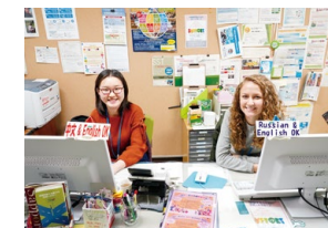
留学生咨询部门(留学生同伴互助)