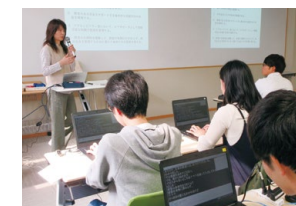
残障人士无障碍环境部门