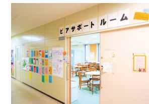
学生咨询部门(日本学生同伴互助)